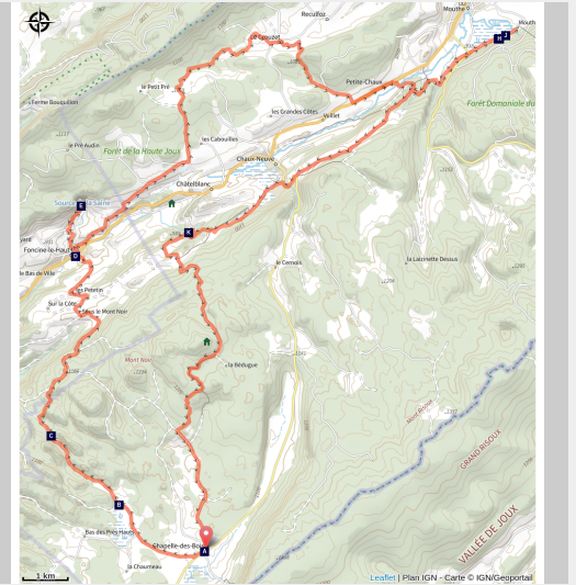
Cascade du Bief Brideau (Cascades de France)

Entre combes arborées, petits villages et tourbières